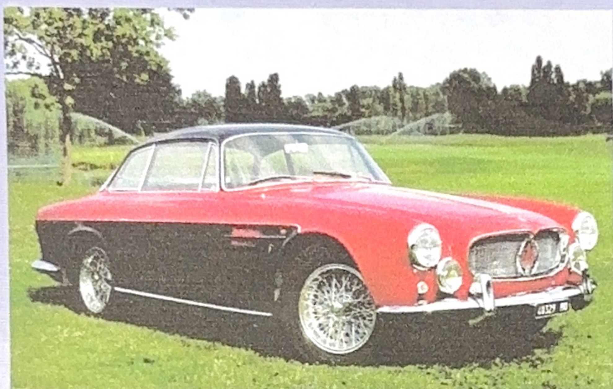
1956 A6G/54 Allemano (Marcel Lammeree)