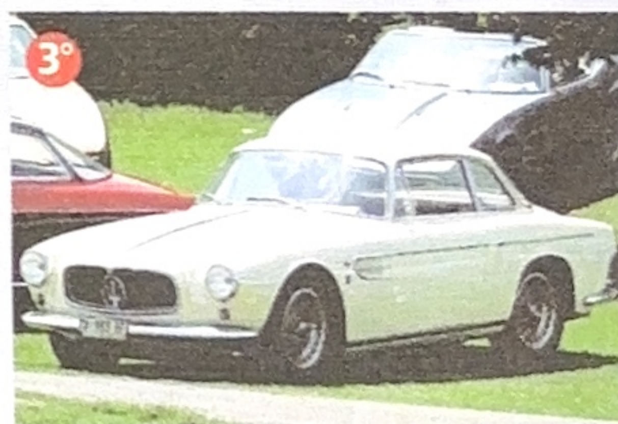
1956 A6 G/54 Allemano (Franco Tralli)