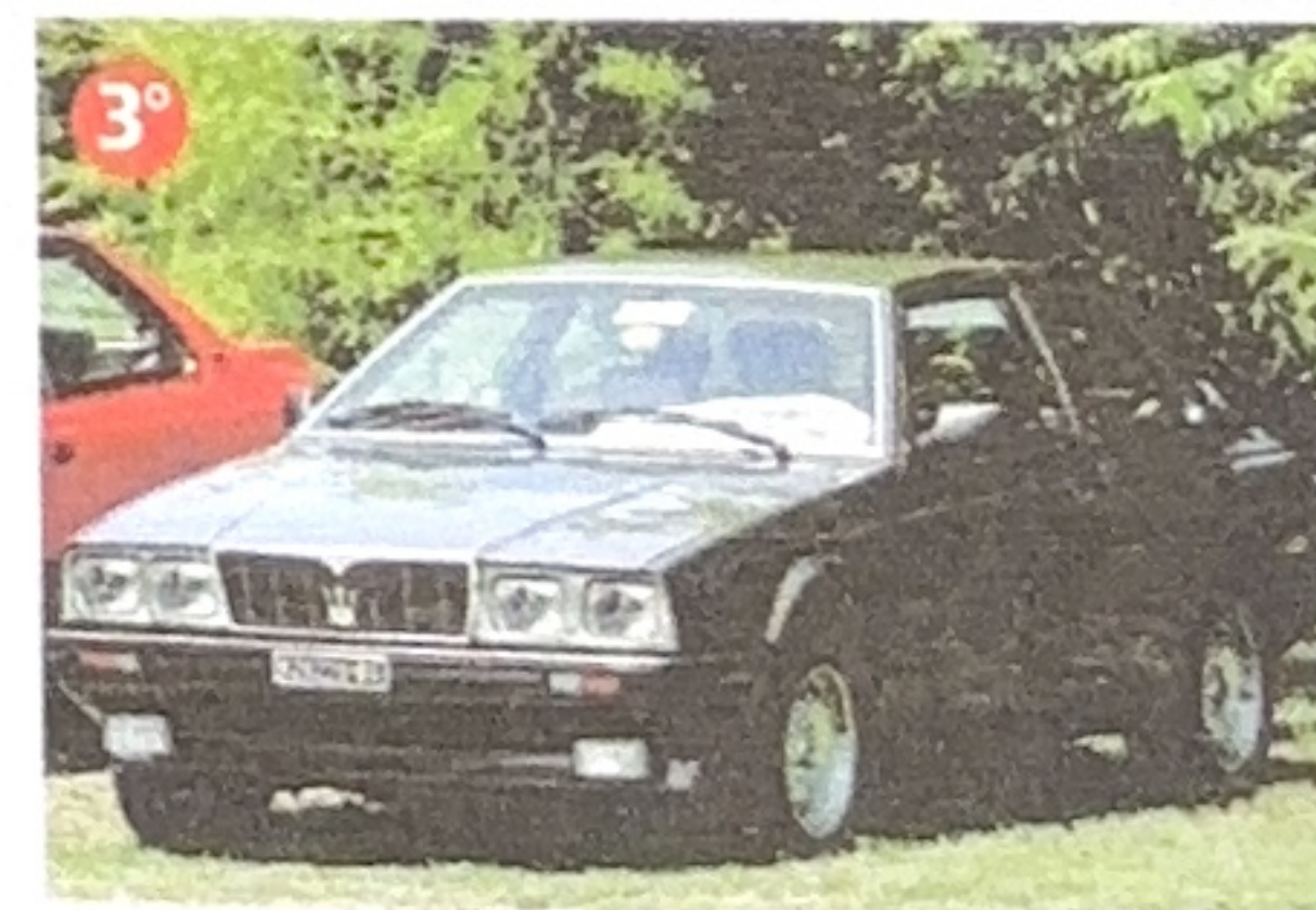
1983 Biturbo (Carlo Carugati)