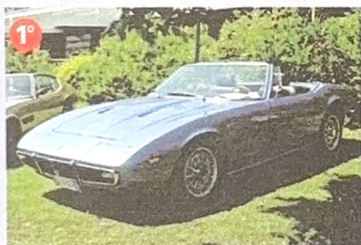
1972 Ghibli SS Spyder (Marcello Candini)