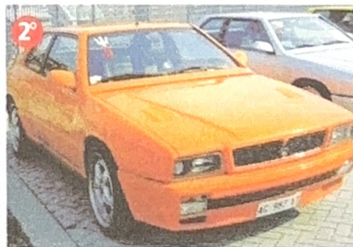
1996 Ghibli CUP (Aldo Foroni)