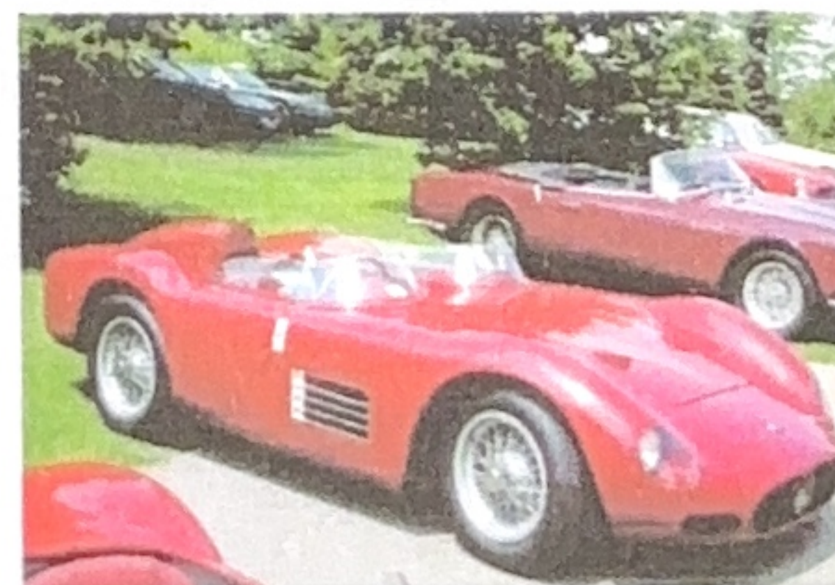
1956 200S (Nicola Sculco)