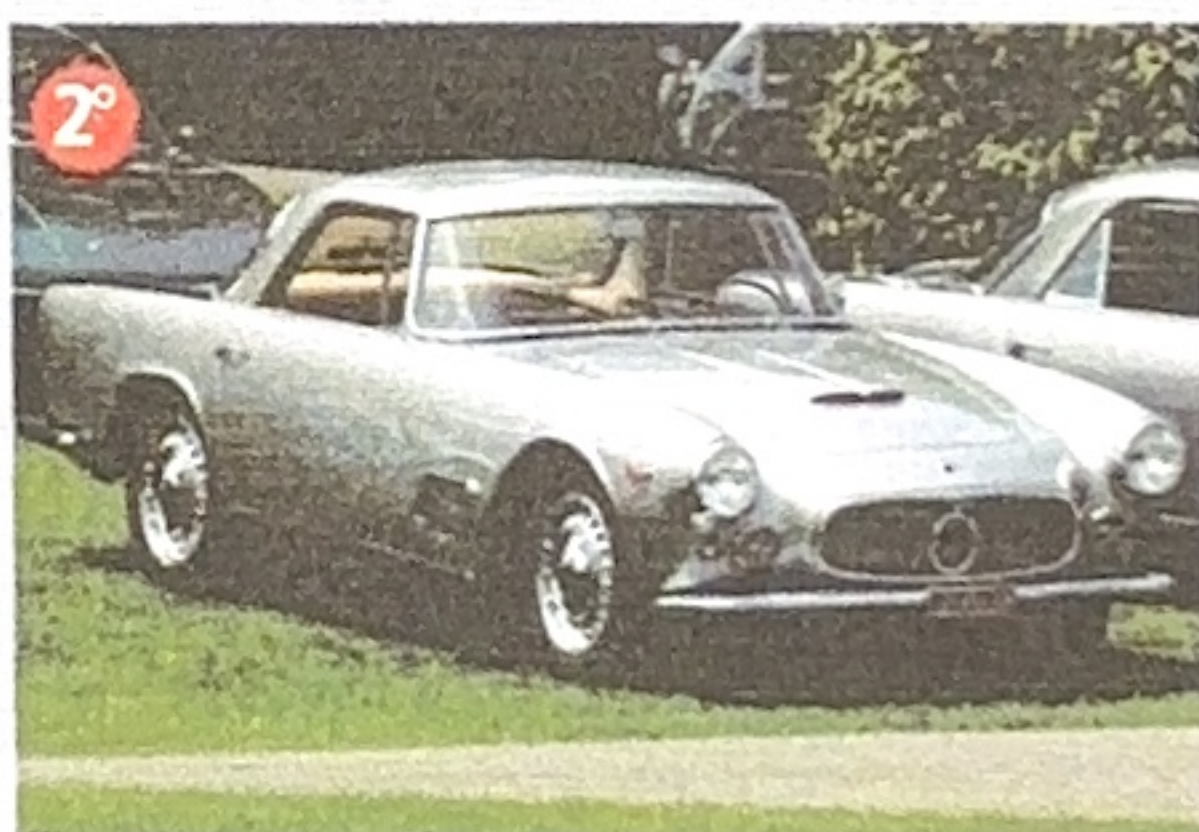
1959 3500 GT