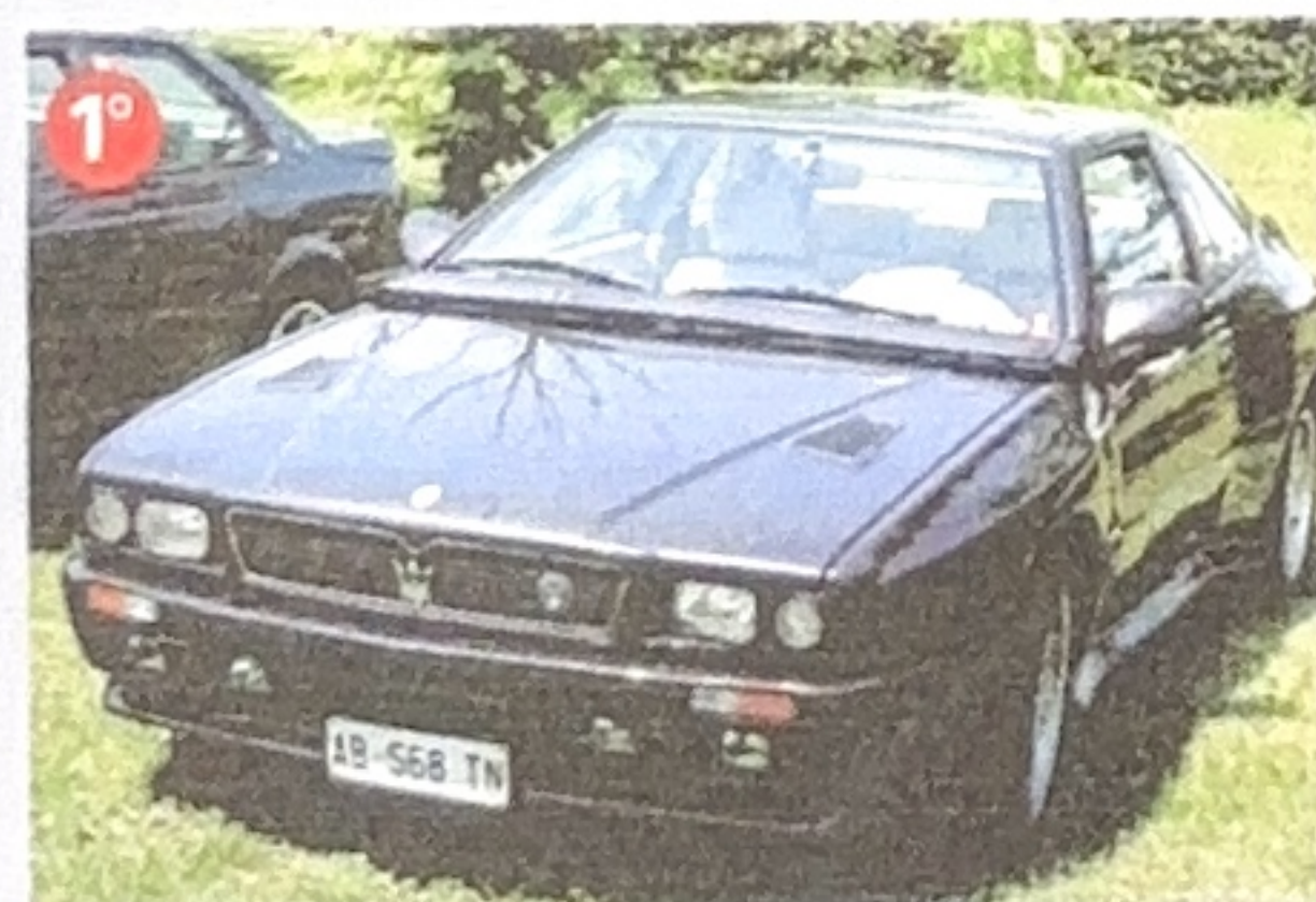
1992 Shamal (Nadir Bicelli)