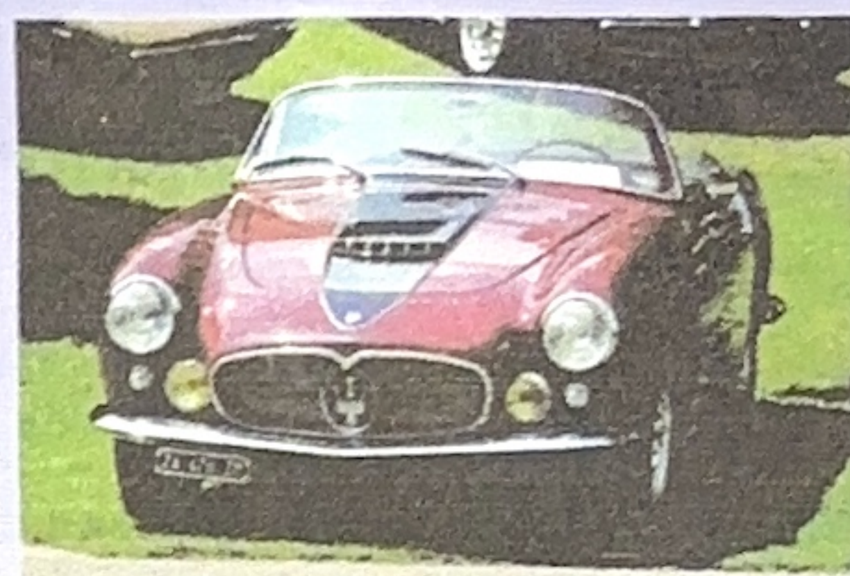
1956 A6 G/54 Spyder Frua (Igor Zanisi)