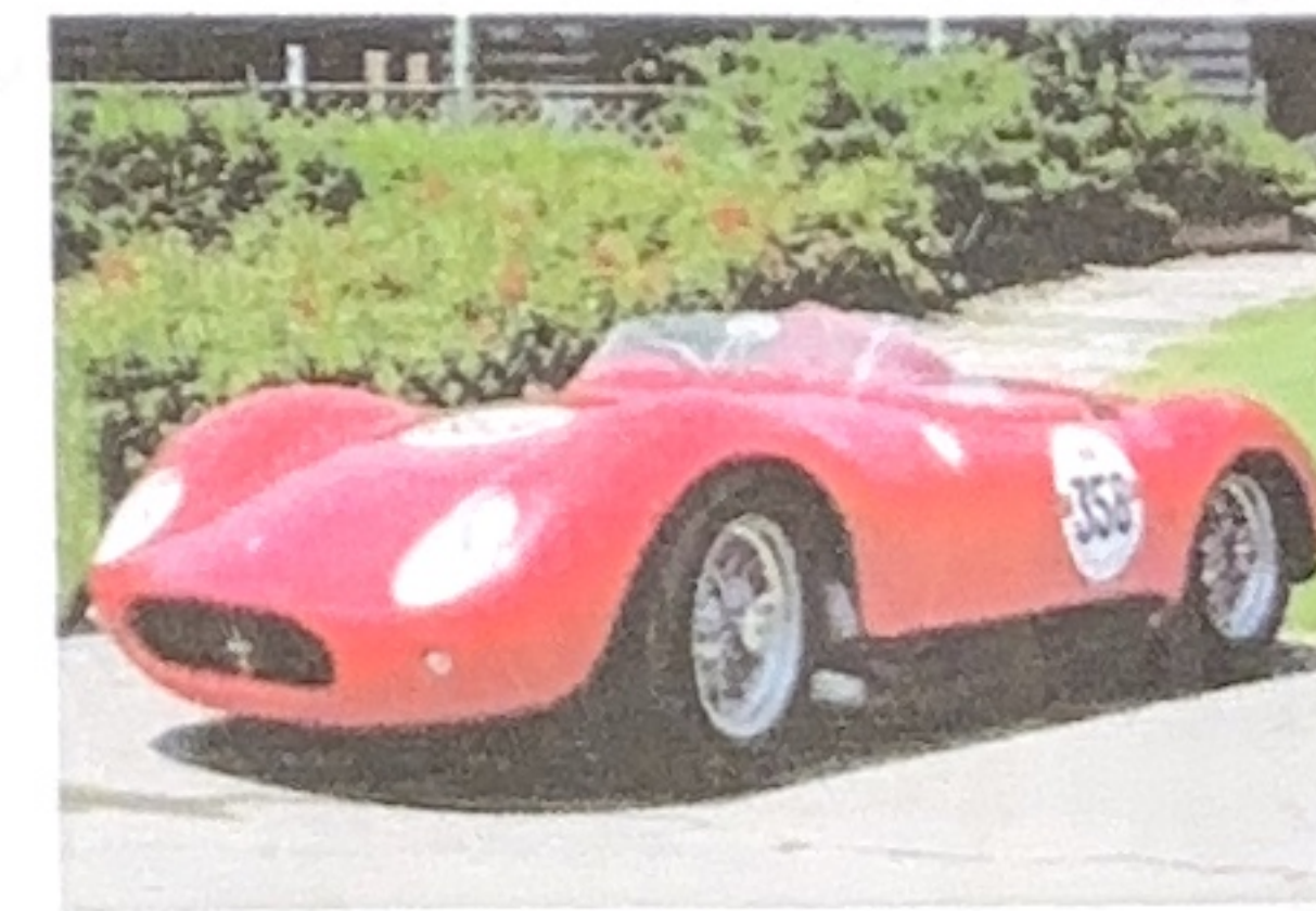
1956 200S (Antonio Alberoni)